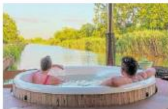
The houseboat's Nordic bath is a great place to unwind at the end of a tough day tasting Champagne.

In 2015, "the Champagne hillsides, houses and cellars" were added to