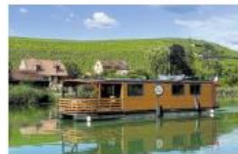
The houseboat navigates the scenic canals of Champagne, where you can moor at a different