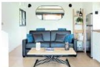
Sleeper couch on the houseboat.